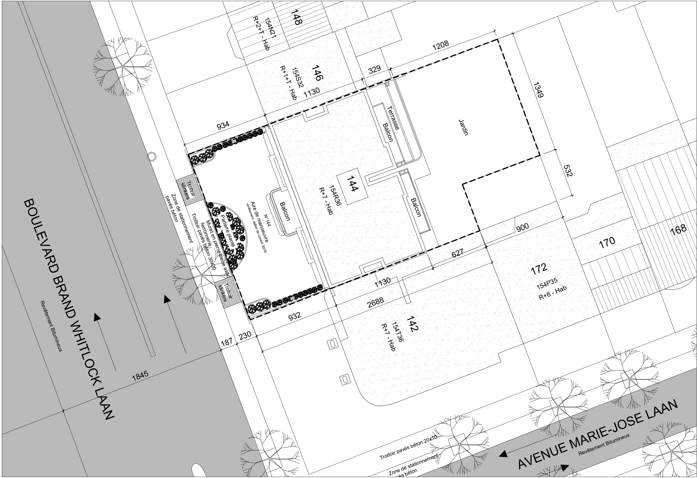
Plan d'implantation - 1/100